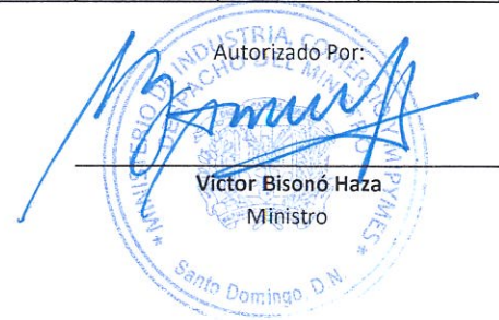
Victor Bisono Haza Ministro