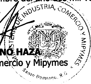
VÍCTOR O. BISONO HAZA Ministro de Industria, Comercio y Mipymes

DADA y firmada en la Ciudad de Santo Domingo, Distrito Nacional, Capital de la República Dominicana, al día treinta (30) del mes de septiembre del año dos mil veintidós (2022).