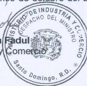
Lic. José Ramón Fadul Ministro de Industria y Comercio

DADA y firmada en la Ciudad de Santo Domingo, Distrito Nacional, Capital de la República Dominicana, al primer (01) día del mes de octubre del año dos mil diez (2010).