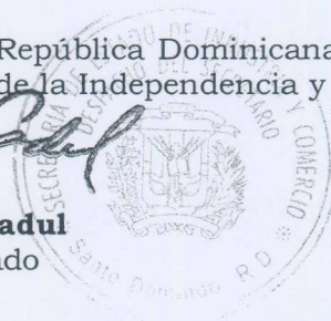
Lic. José Ramón Fadul Secretario de Estado

DADA en Santo Domingo, D.N. Capital de la República Dominicana a los 24 días del mes de Julio del año 2009, años 166 de la Independencia y 144 de la Restauración.