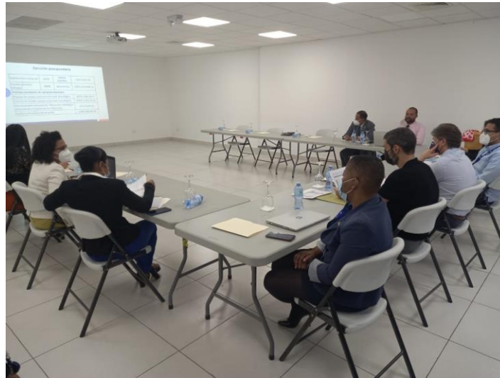
Reunión con la AACID y el MEPyD, en la Torre MICM