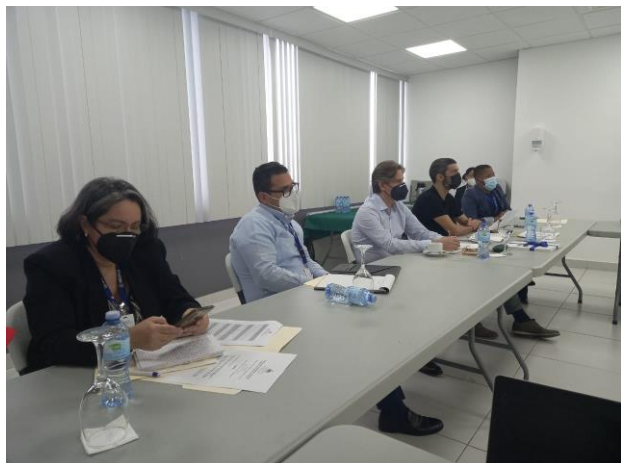
Reunión con la AACID y el MEPyD, en la Torre MICM