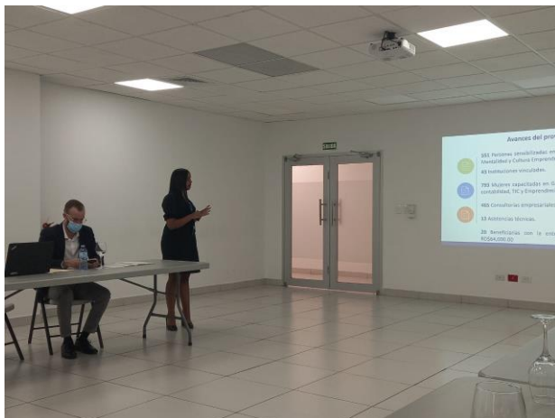
Reunión con la AACID y el MEPyD, en la Torre MICM