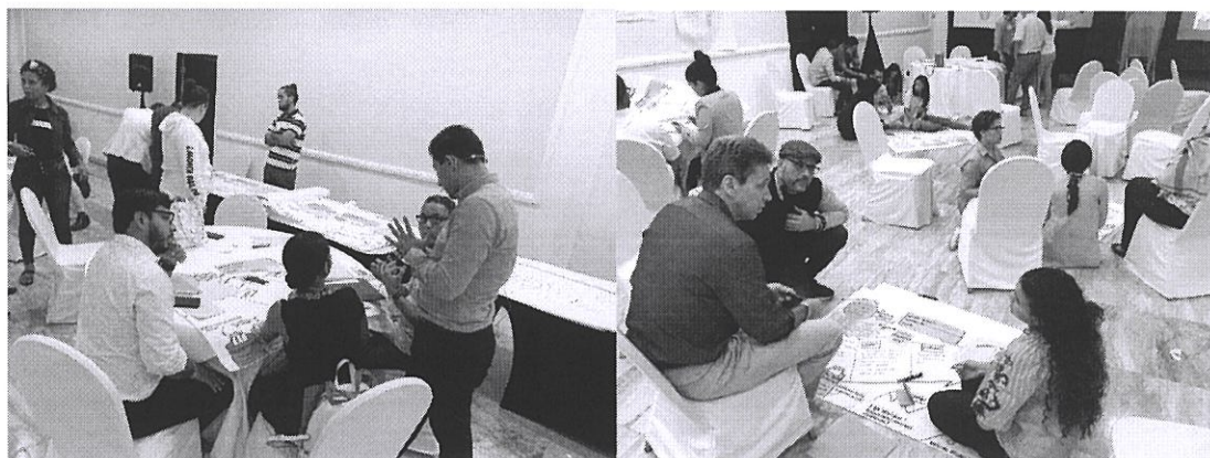
Taller Design Thinking