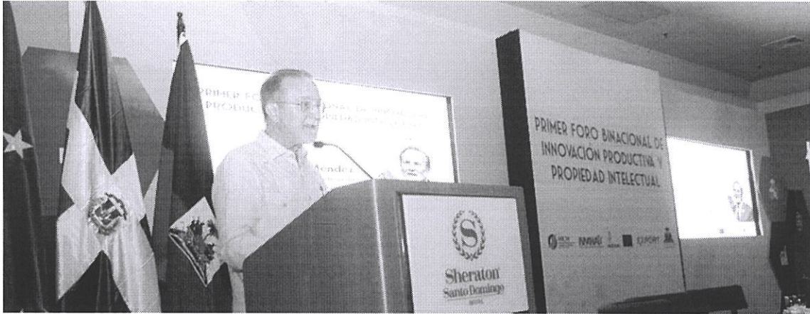
Participación del Viceministro Ignacio Méndez

Asimismo, se presentaron algunos casos de éxito del proyecto, y la segunda edición del documento “Pequeñas empresas abren sus puertas a la innovación”, el cual recoge unos veinte testimonios de empresarios Mipymes que forman parte de dicho proyecto.