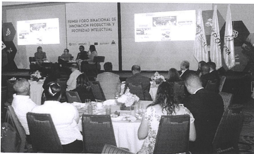
Evento Primer Foro Binacional de Innovación Productiva y Propiedad Intelectual

En el mes de diciembre de 2019, se celebró el primer Foro Binacional de Innovación Productiva y Propiedad Intelectual, actividad que tuvo como propósito presentar las principales acciones que se llevan a cabo en el país y en Haití para impulsar la protección de la propiedad intelectual e innovación.