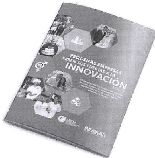
Segundo Volumen “Pequeñas Empresas Abren sus Puertas a la Innovación”

Asimismo, se presentaron algunos casos de éxito del proyecto, y la segunda edición del documento “Pequeñas empresas abren sus puertas a la innovación”, el cual recoge unos veinte testimonios de empresarios Mipymes que forman parte de dicho proyecto.