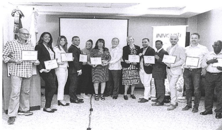
Acto de entrega de maquinarias

Otra de las acciones llevadas a cabo en el citado período fue el acto de entrega de maquinarias a once (11) micro, pequeñas y medianas empresas (Mipymes), con el propósito de que estas mejoren sus procesos productivos. Dicho evento, contó con la presencia de Inka Mattila, representante adjunta del Programa de las Naciones Unidas para el Desarrollo (PNUD) en la República Dominicana y del viceministro de Fomento a las Mipymes, el señor Ignacio Méndez.