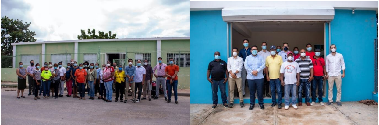
Asociación de Pescadores, Asociación de Guías de Naturaleza y Asociación de Madres, en la provincia Pedernales.