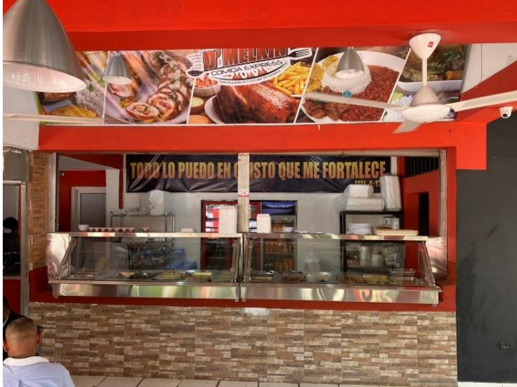
Empresa D' Melkin Comida Express