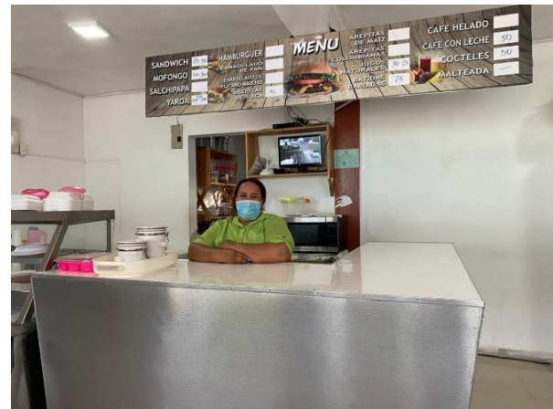
Empresas D' YEY Heladería y Restaurante Dominga Gourmet