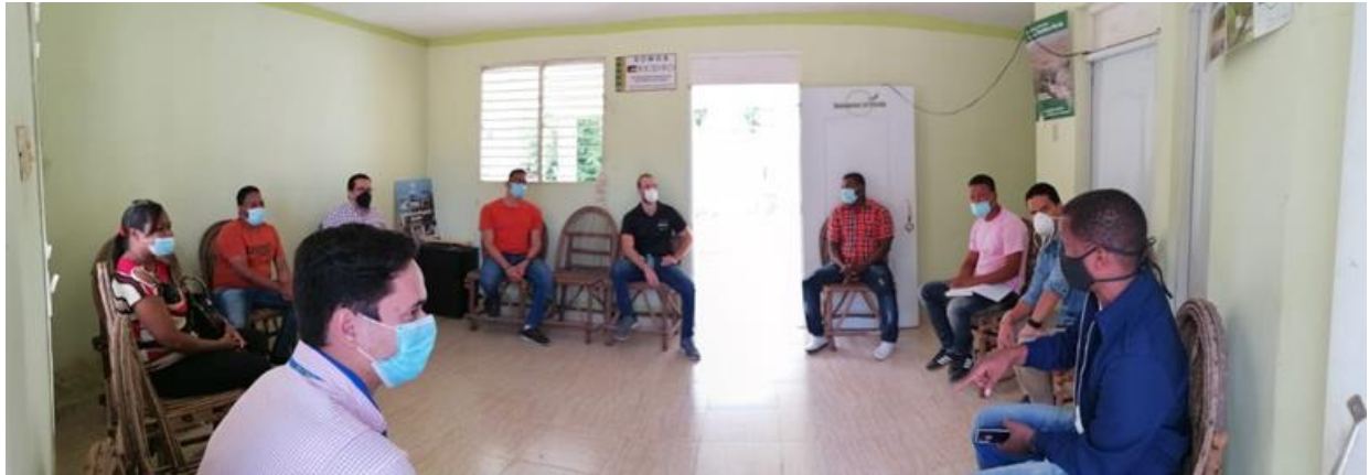
Asociación de Pescadores, Asociación de Guías de Naturaleza y Asociación de Madres, en la provincia Pedernales.