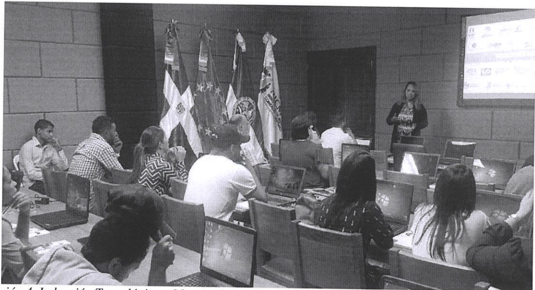
Ilustración 4. Inducción Tecnológica y Manejo de la Plataforma de Ventanilla Única de Comercio Exterior, VUCE.