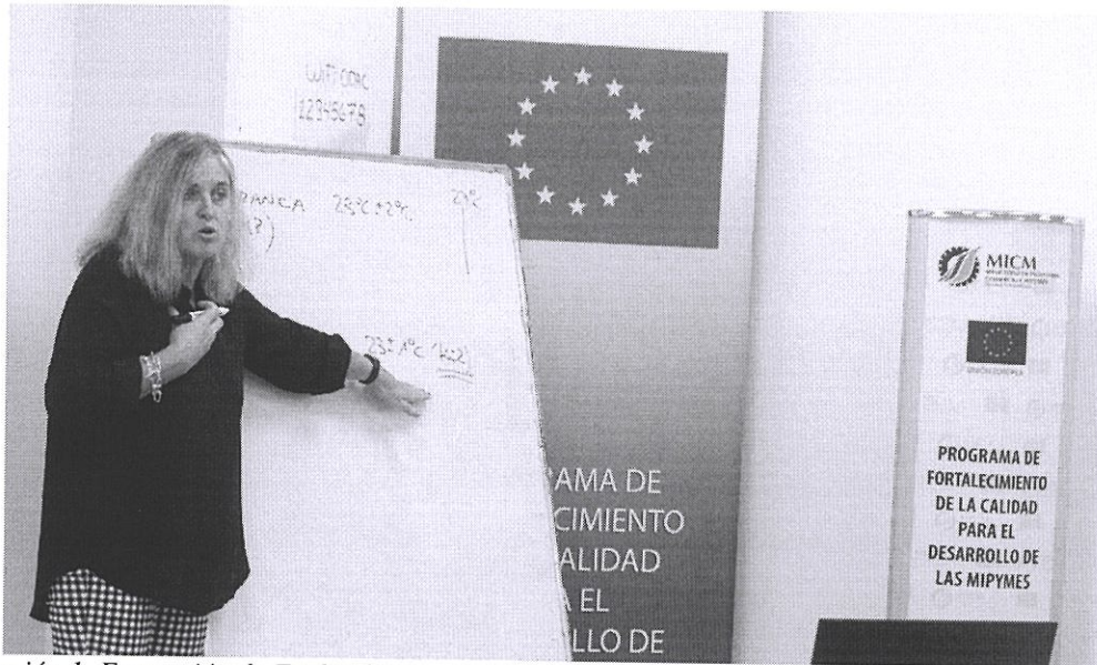
Ilustración 1. Formación de Evaluadores para Métodos de Calibración, Norma ISO/IEC 17025-2017.