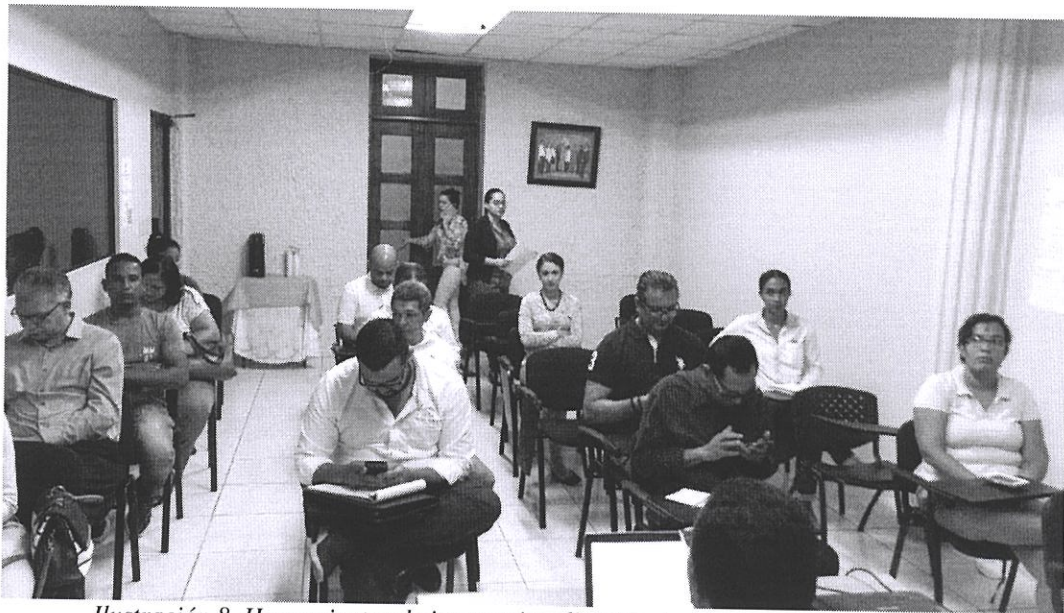
Ilustración 8. Herramientas de internacionalización de empresas para las Mipymes.