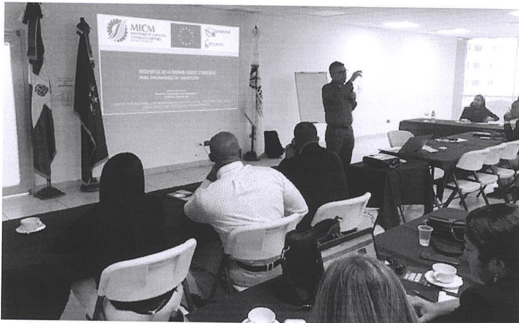
Ilustración 2. Requisitos para la Acreditación de Organismo de Inspección, Norma ISO/IEC 17020.