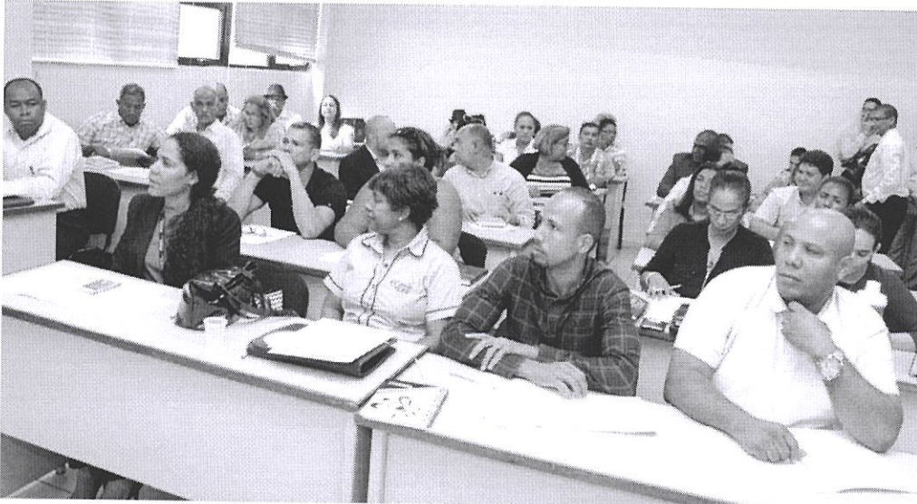
Ilustración 5. Taller de Buenas Prácticas de Manofactura en Sector Cosmético.