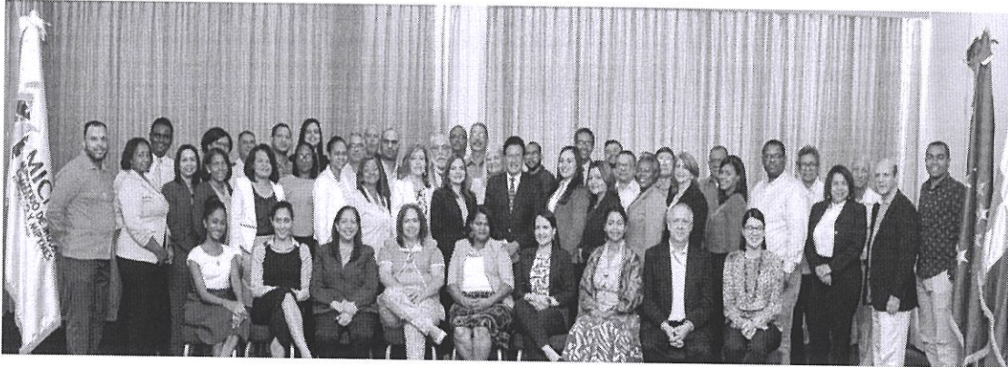
Ilustración 3. Diplomado Normalización y EC, dirigido a Normalizadores.