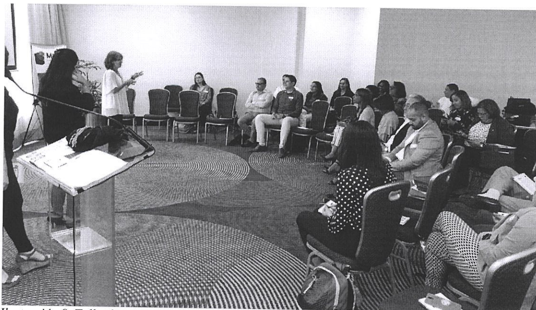
Ilustración 9. Taller levantamiento de información para la actualización de los manuales de los Centros Mipymes.