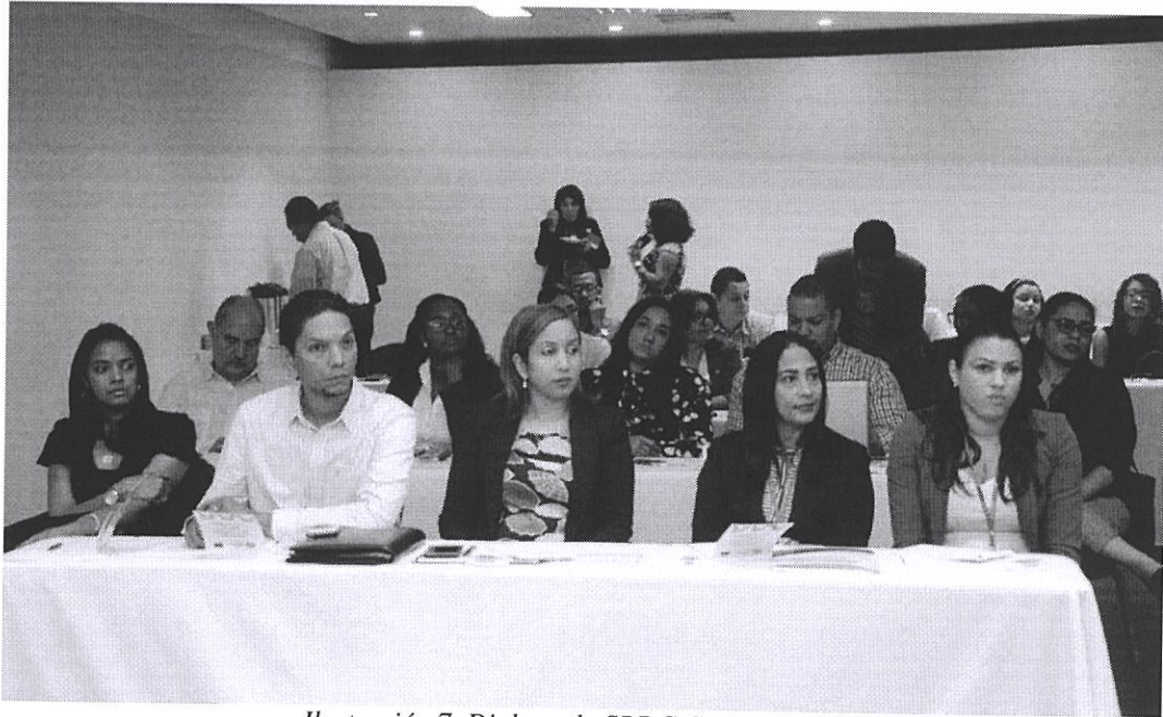
Ilustración 7. Diplomado SBDC Centro Mipymes.