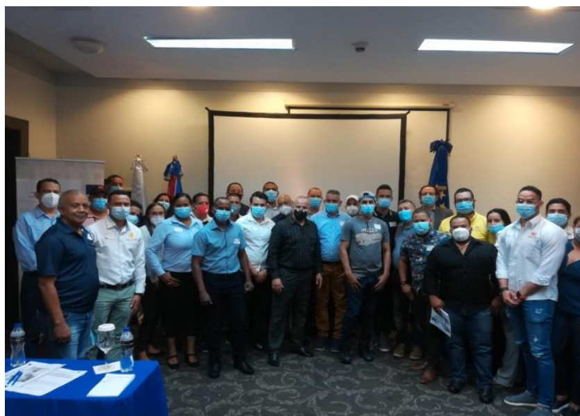
Ilustración 7. Capacitación en temas de P+L y economía circular a Mipymes en Santiago de los Caballeros al sector arrocero