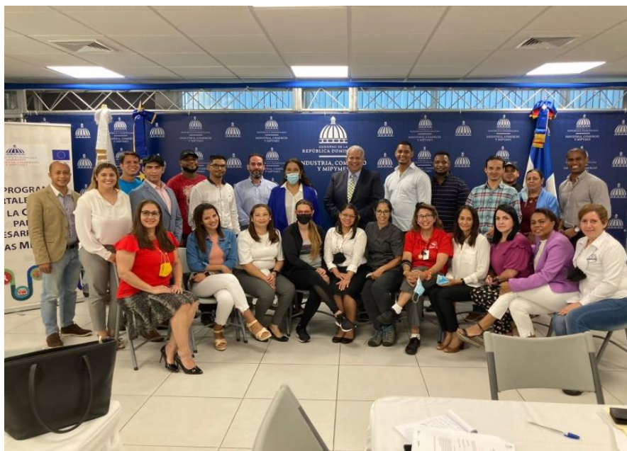
Ilustración 4. Capacitación en temas de P+L y economía circular aplicada a la Industria Gastronómica