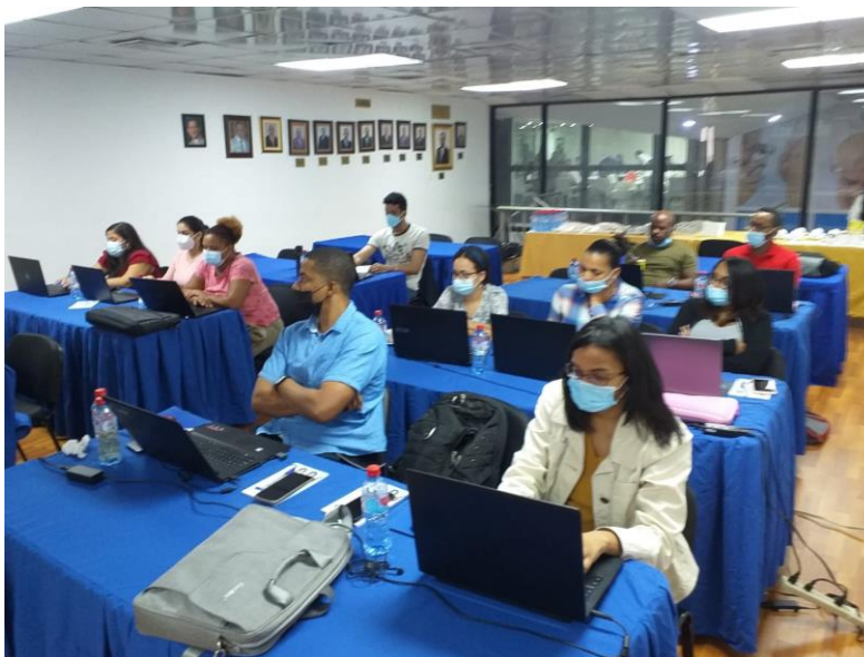
Ilustración 1. Taller validación de metodologías analíticas y estimación de la incertidumbre de las mediciones según norma ISO 5725 e ISO 98