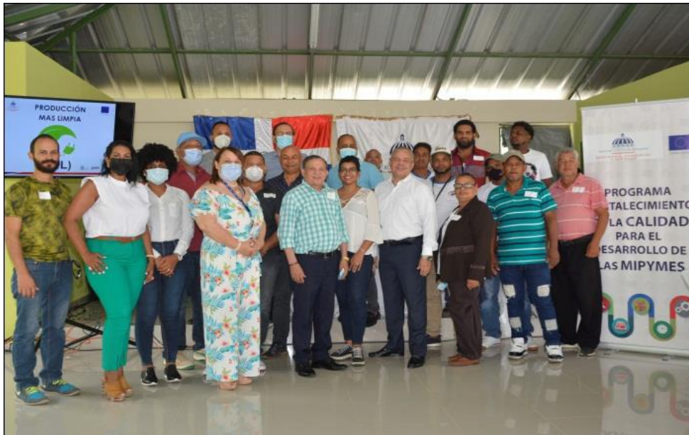
Ilustración 8. Capacitación en temas de P+L y economía circular a Mipymes al sector mueble en Burende, La Vega