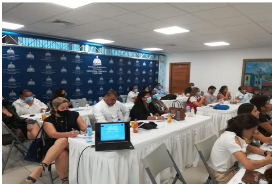
Ilustración 5. Capacitación en temas de P+L y economía circular aplicada a la Industria Gastronómica