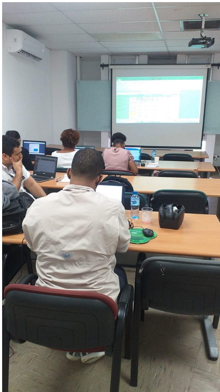
Ilustración 3. Asistencia técnica empresa Certificadora