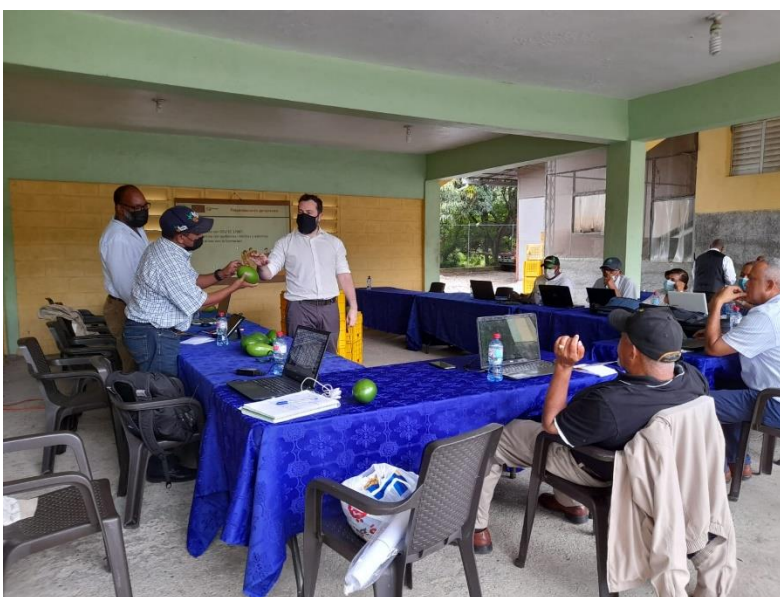
Ilustración 2. Formación de auditores internos del clúster del aguacate para la Norma ISO/IEC 17065:2012