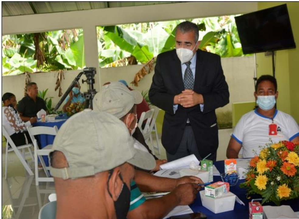
Ilustración 9. Capacitación en temas de P+L y economía circular a Mipymes al sector mueble en Burende, La Vega