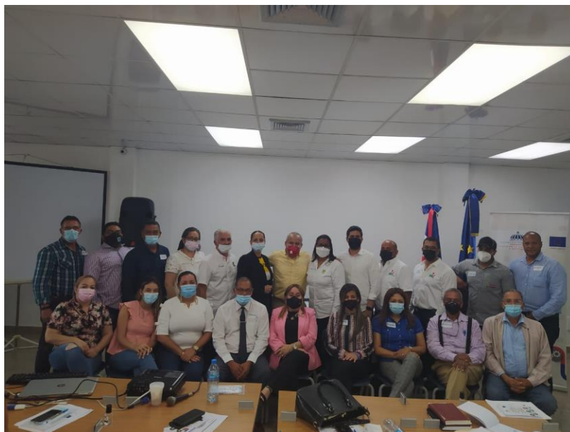
Ilustración 6. Capacitación en temas de P+L y economía circular a Mipymes en el municipio de Moca