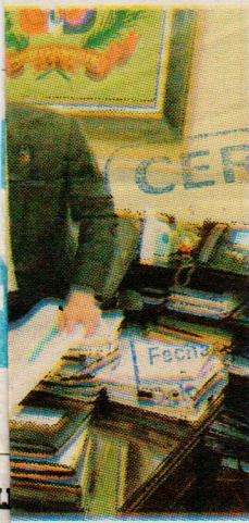
mientras revisaban los planos