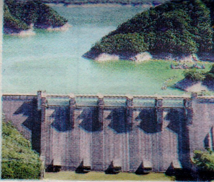
Embalses se llenaron. F.E

Indicó que, el aumento de turbidez en los acueductos Haina, Manoguayabo e Isabela, requieren de desinfección para