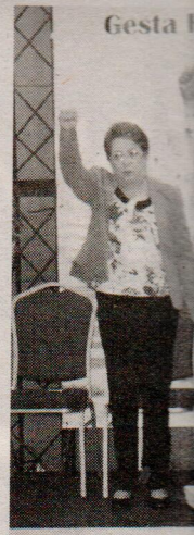
PLD reconoce gestas

El edil, citó de manera puntual, las plazas Juan Pablo Duarte, el Monumento a la Caña, Plaza Mella, Plaza Sánchez, el entorno del Faro a Colón, la avenida España y 35 parques de todas las circunscripciones.