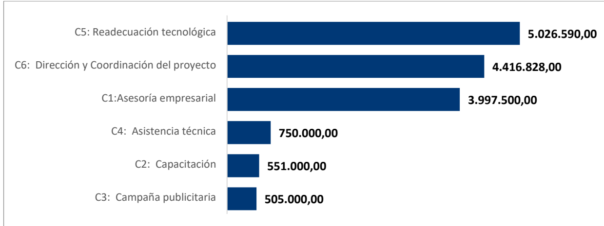
Gráfica 2. Distribución presupuestaria por componente del proyecto Transferencia de Capacidades para la Implementación de Procesos de Producción más Limpia en Pequeños Hoteles de Pedernales, valores expresados en RD$.